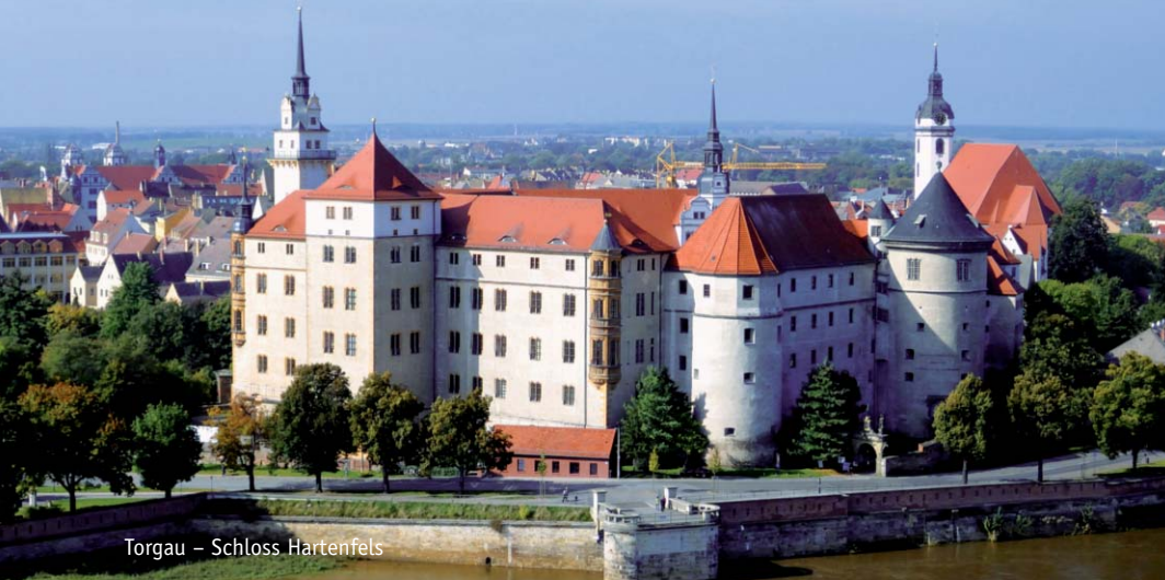
Torgau – Schloss Hartenfels